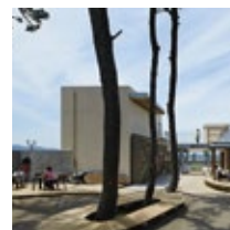
地元の旬野菜をたっぷり使ったヘルシーな手作りデリから、お好みの主菜・副菜を選べるデリランチは税別890円から。テイクアウトして屋外席や海でランチを楽しめば、ピクニック気分が味わえます。