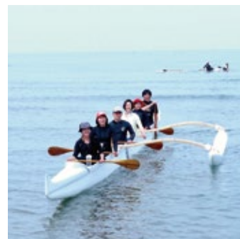
波の穏やかな北条海岸では、夏季限定でSUP(スタンドアップパドル)や6人乗りのアウトリガーカヌーの体験プログラムも開催(すべてウェブ予約制)。開催日時のご確認は、seadays.jpでどうぞ。